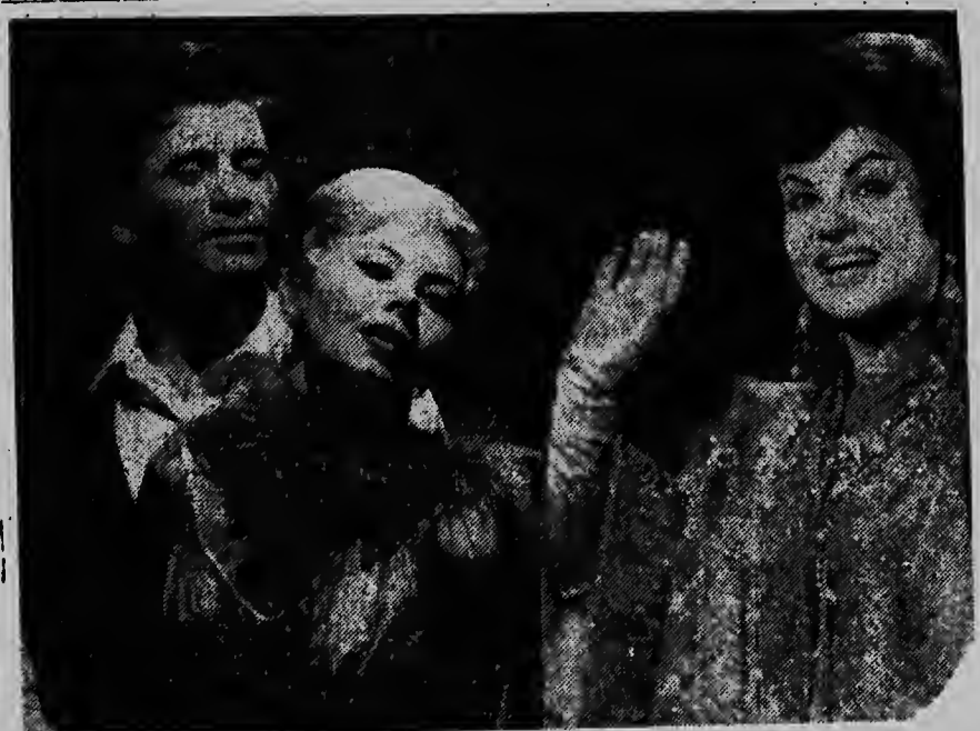
Aki 'riba: na rohez „The Lomans" pareha di baile y no drechi Nejlja Iz cu ta canta.

E parti mas importante di e trabao di Voogdijraad ta e cobramiento di e placa di alimentacion serca e tatanan. Esaki e trabo haci facilmente pa e raad, como cu nan por confisca e placa y hasta e propiedad, asina cu e tata no ta di acuerdo pa di su mes voluntad manda e placa di alimentacion cada luna pa e mama. Kendenan ta esunnan cu awor ta worde treci dilanti huez, ta e p'curata. Esey ta esunnan, cu ta nenga di cumpli cu nan deber di alimentacion y di kende Voogdijraad sabi cu nan por cumpli cu nan deber. Y e caballeronan aki, alfin ta bai hanja un „stratton" sumamente stricto. Articulo 272 di buki di